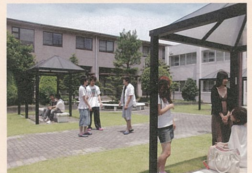
「大学内学生スペースの整備」

古本の集荷・仕分け・買い取りについては、株式会社バリューブックスに運営をお願いしています。