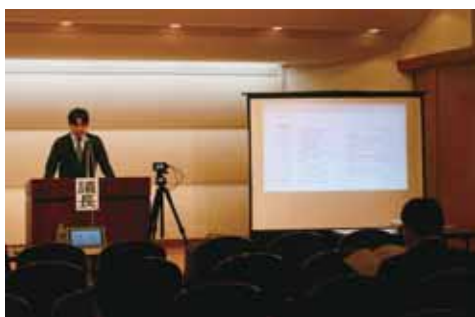
6/26 総会 Zoomを活用し開催