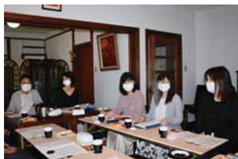
旧宣教師館にて幹事会の様子