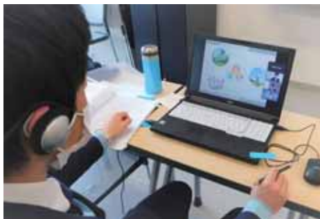
業界勉強会はオンラインで開催しました。

静岡英和は、本気になって学ぶことができる環境が整っています。日々の学業をコツコツと積み重ね、学びの楽しさを発見することも大きな経験です。私達は、このような学生達が自分で意識していない大きな経験を引き出し、就職後の豊かな人生まで見据え、地に足の着いた支援を行っていきます。