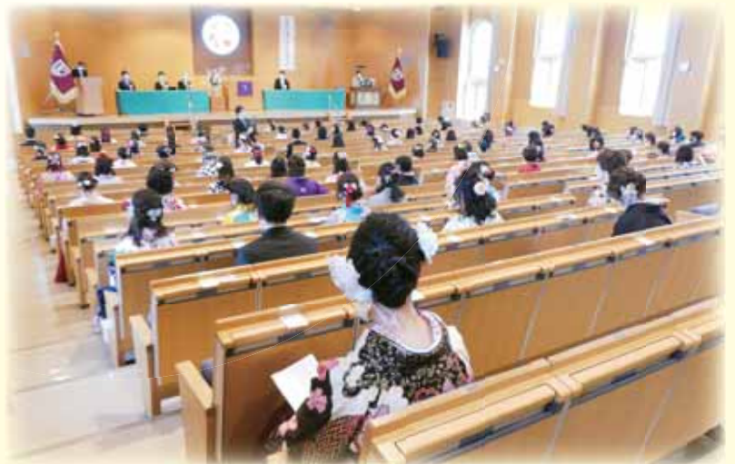
感染対策を施して行われた卒業式